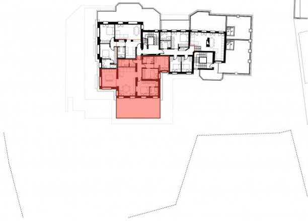
PLANIMETRIA GENERALE PIANO TERZO - scala 1:500